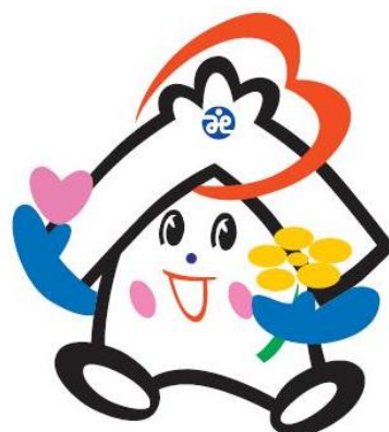
川越市社協のキャラクター 福っくらちゃん

試験についてのお問い合わせは 社会福祉法人川越市社会福祉協議会 総務課 企画総務担当 〒350-0036 川越市小仙波町2丁目50番地2 ☎049-225-5703