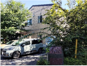
⑧グループホーム愛の家