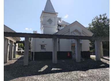
⑩リバーサイド吉番街集会場