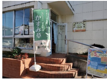
⑨コミュニティサロンかすみ草