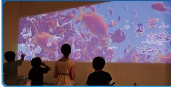
私の描いた魚が泳ぎだす巨大水族館