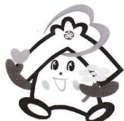
川越市社協のキャラクター の 福っくらちゃん