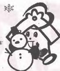
川越市社協のキャラクター 福っくらちゃん

*各会館の休館日及び祝祭日は、閉室となりますので来室の際は電話で確認してください。