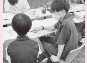
「チアアップ彩たま」による 学習支援の様子