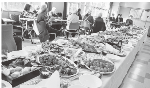
在宅高齢者等給食サービス (霞ヶ関地区)