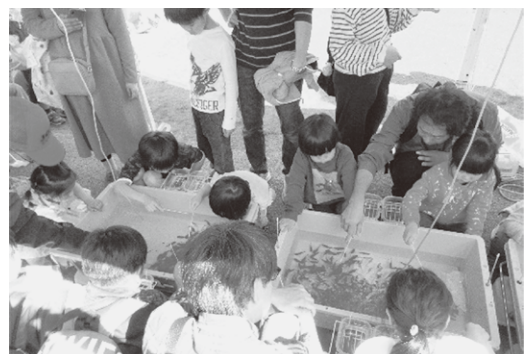
親子で楽しめました!