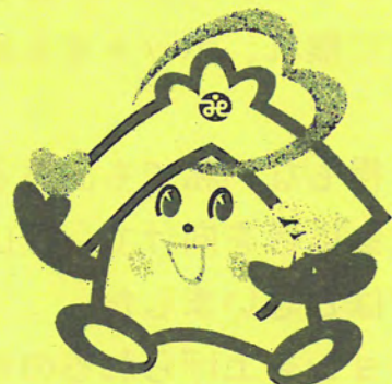
川越市社協のキャラクター