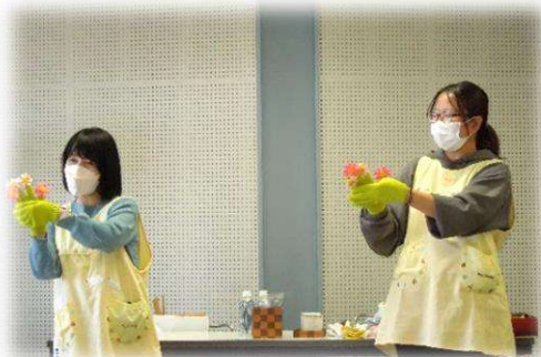
子育て支援センターの保育士による 子どもの遊びについての講義