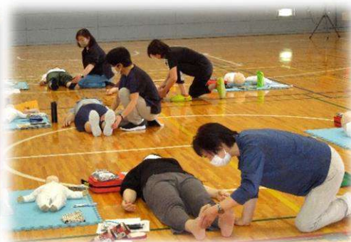
いざという時にあわてないように、 AEDを使った救急法を学びました