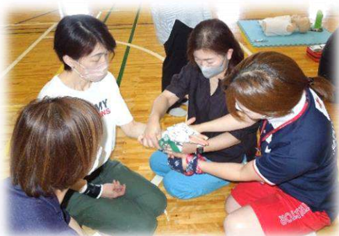
身近にあるハンカチを使って 止血する方法を学びました