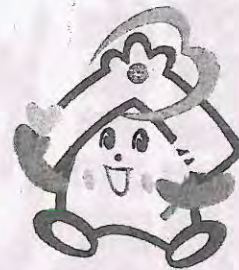
川越市社協のキャラクター ふっくらちゃん

川越市ボランティアセンターのホームページ http://www.kawagoeshi-vc.or.jp/