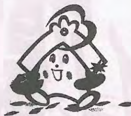
川越市社会福祉協議会 キャラクター 福っくらちゃん

川越市ボランティアセンターのホームページ http://www.kawagoeshi-vc.or.jp/