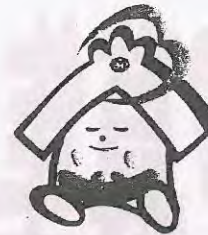
川越市社協のキャラクター 福っくらちゃん

川越市ボランティアセンターのホームページ http://www.kawagoeshi-vc.or.jp/