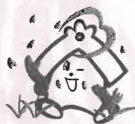
川越市社協のキャラクター 福っくらちゃん