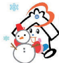
川越市社協のキャラクター 福っくらちゃん