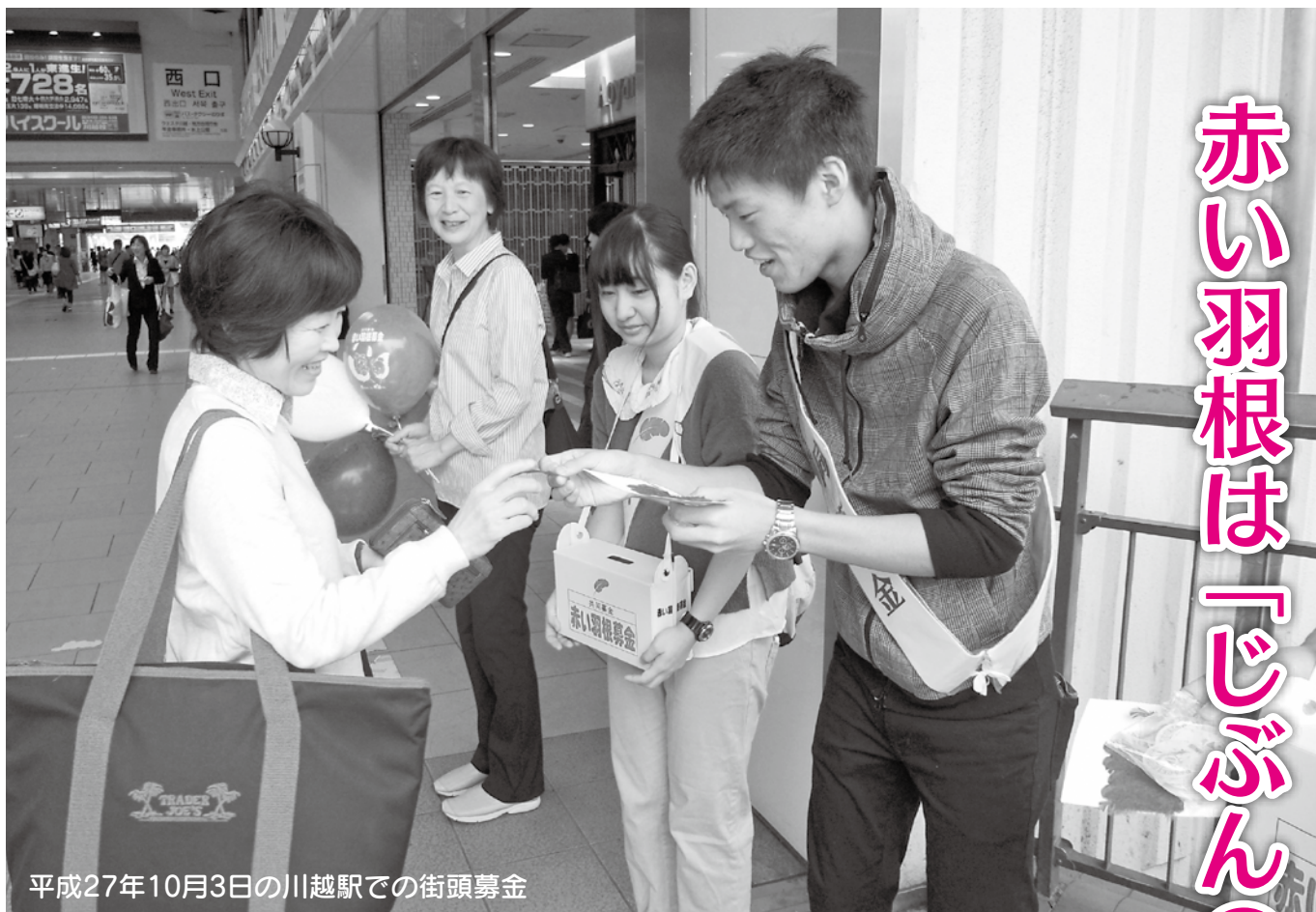
平成27年10月3日の川越駅での街頭募金