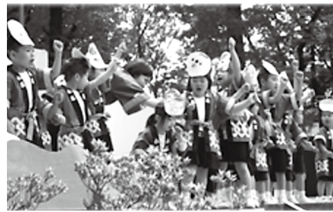
ステージコーナー