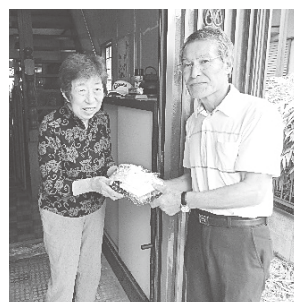
お弁当をお渡しする様子

霞ヶ関地区社協では、65歳以上の一人暮らしの方を対象に、毎月2回ボランティアグループ「やまぶき」による配食を実施しています。民生委員とボランティアがお宅を訪問し、お弁当を手渡ししながら、生活状況を聞いたり、地区の催し物の案