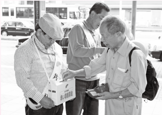
左上：新河岸駅での街頭募金活動。右上：川越駅での街頭募金活動。左下：本川越駅での街頭募金活動。