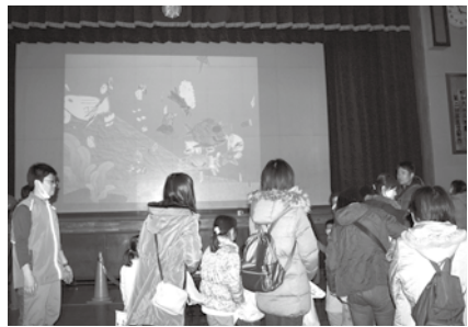
書いた絵が水族館で泳いだよ！

就学児から小学校低学年までの児童とその家族、約千人の方に来場いただきました。参加者には、書いた絵が大きなスクリーンの中で動くアトラクションや、消