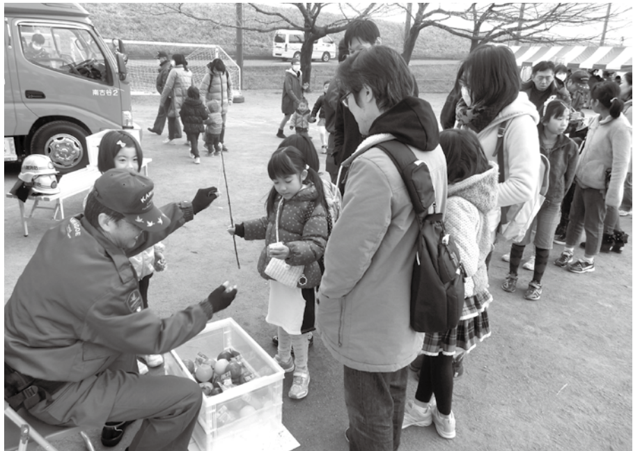
一生けんめい“消防グッズ”を釣ったよ！

1月29日(日)、川越市教育センターにて、親子リフレッシュ事業を開催しました。この事業は、親子が一日楽しめる催し物を通して、絆を深めてもらうことを目的としています。未