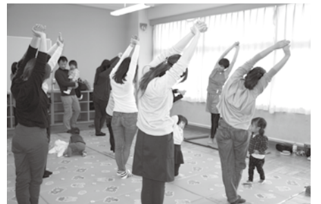
親子で健康になるぞ！