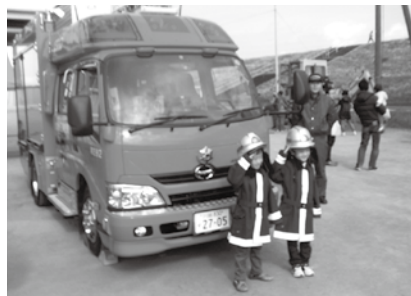
気分は本物の消防士！