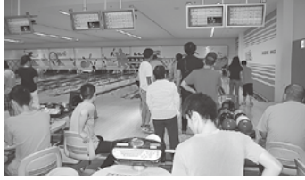
28年度 ボウリング大会の様子