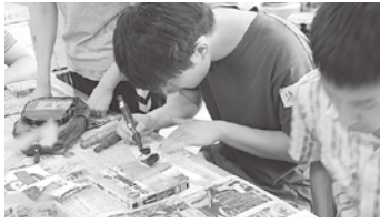
28年度 創作活動の様子