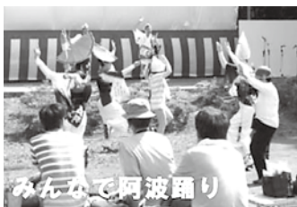
みんなで阿波踊り