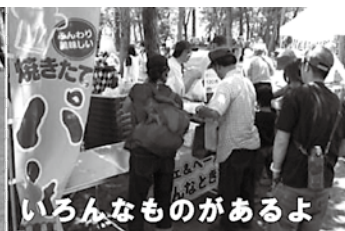
いろいろなものがあるよ