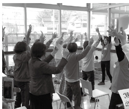
生活支援体制整備推進事業の取組み 福原地区 健康講座inウエルカフエ