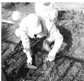
家事支援 草むしりの様子

このサービスは、日常の家事に支援を必要とする高齢者等を対象としたサービスで、生活必需品の買い物の代行や草むしり、簡単な庭木の枝切