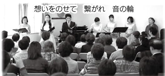
想いをのせて 繋がれ 音の輪

出演者と来場者が音楽を通して“ひとつの輪”となり、被災地と地元川越へ支援のあたたかい気持ちを届けました。