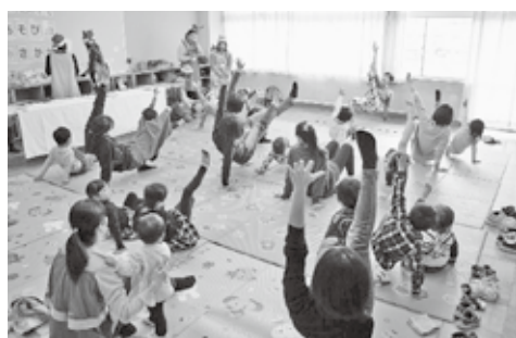
親子で楽しく健康に