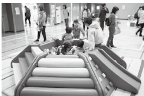
ボールプールで遊んだよ

昨年12月2日(日)、川越市教育センターで、親子リフレッシュ事業を開催しました。 この事業は、未就学児から小学校低学年までの児童とその保護者を対象に、一日親子で楽しむことを目的として実施しています。