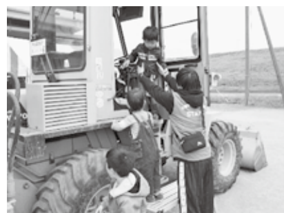
働く車と記念撮影

本年度は3回目の開催となり、約300名の方に来場していただきました。 今年度は、いつものお絵かきアトラクション、親子リフレッシュユガ、親子ふれあい遊び&読み聞かせ、働く車と記念撮影、キッズ広場等に加え、新たに《親子で防災体験コーナー》を設けました。 防災についてのクイズや、防災食「IZAMESHI」の紹介コーナーがあり、非常食のパンの無料配布もありました。 来年度も、さらに楽しんでいただき、親子の絆が深まるように、内容を充実させて開催いたします。