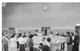
【↑バケツにポンの様子】

日時 8月25日(日) 午前10時～正午 受付：午前9時40分～ 会場 総合福祉センター 2階 体育室 経費 無料 対象 どなたでも 申込み 不要です。当日直接、会場へお越しください。