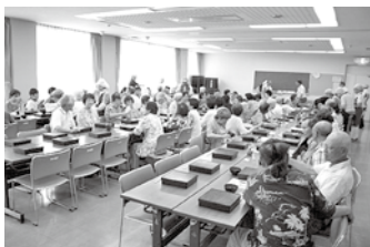
世代間交流(第5地区)

その活動財源の一つとして、会員の皆さまからの会費があります。ご協力いただきました会費につきましましては、福祉団体への助成や広報活動に使われています。 市社協では、7月を会員募集の強化月間としており、地区社協を通じて自治会ごとに回覧等で会費を集めています。 封筒の中に入れていただき、専用の封筒の中に入れてお申し込みください。ご協力をお願い申し上げます。