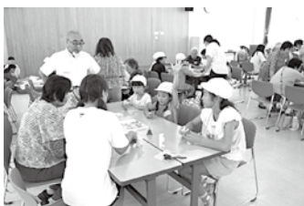
在宅高齢者等給食サービス(川鶴地区)