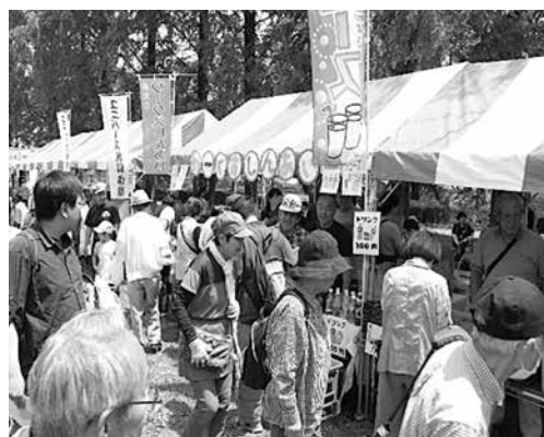
大にぎわいの模擬店コーナー

どんな内容? ふれあい福祉まつりは、参加団体の代表者から構成される実行委員会と市社協の共催で行われます。このまつりは、参加団体だけでなく来場者も一緒になって『みんなで作る』をテーマに開催しています。 ステージ、交流、福祉体験、模擬店の4種コーナーに分かれ、それぞれが特徴ある内容となっています。 第29回となる今年は、「平成から令和へ福祉の笑顔つなげよう!!」というキャッチフレーズのもと、92団体(ステージ14、交流19、福祉体験13、模擬店46)が参加し、大変盛り上がりました。