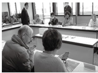
視覚障害者向けスマートフォン教室の様子