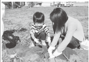
在宅障害児招待事業の様子