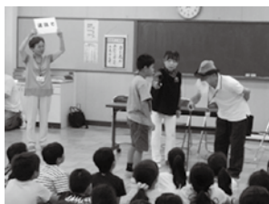
認知症サポーター養成講座の様子