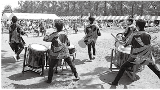
毎年大迫力の川越ふじ太鼓さんによるオープニング