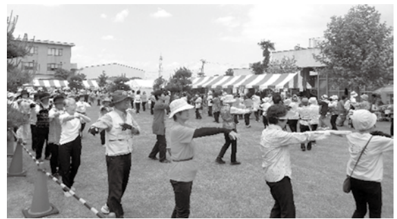
交流コーナーも盛り上がりました！