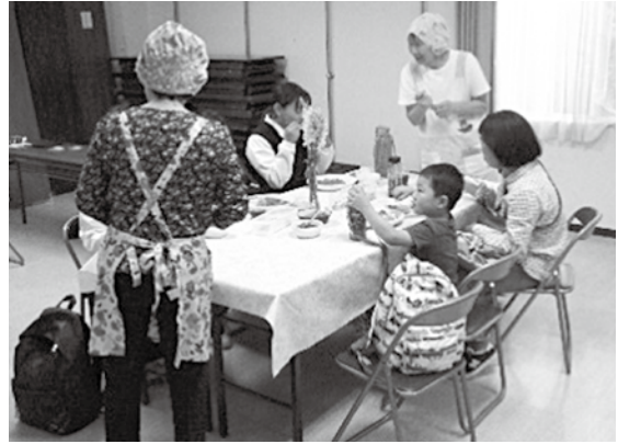
みんなで食べると会話ははずみます！

午後5時から7時半の間帯に幼・保育園児や中学生以下の子どもたち20名とその保護者が参加し、おいしいごはんを前に自然と笑顔