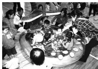
ボールプールの様子♪

対象 0歳から保育園、幼稚園入園前のお子様と保護者の方 経費 無料 持ち物 上履き 問合せ 市社協 地域福祉推進担当 ☎225-5703(代表) ※事前申し込みの必要はありませんので、直接会場にお越しください。