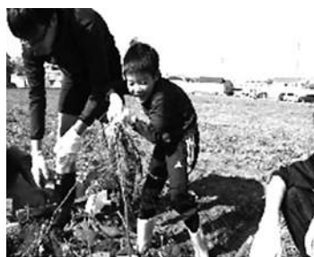
立派なお芋がたくさん♪

在宅障害児招待事業 『芋ほり』 在宅障害児世帯を対象に、芋ほりを開催します。ぜひご参加ください。 日時 11月3日(土/祝) 午前10時～午後2時 ※雨天決行 会場 山田園(川越市中台) 対象者 市内在住で平成13年1月1日以降生まれの身体障害者手帳、療育手帳、精神障害者保健福祉手帳所持者とその家族