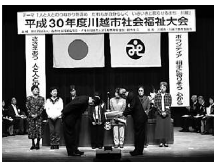
昨年度の受賞の様子

会場 川越市やまぶき会館 入場 無料(一般可) 問合せ 市社協企画担当 ☎2225-5703 (代表)