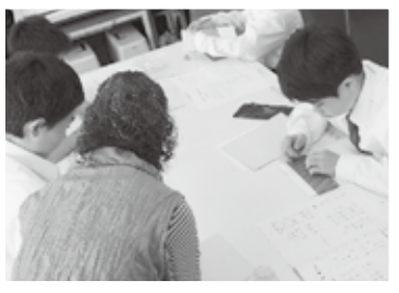
(福祉体験：点字講座の様子)

また、この体験を通して、友達などの些細な変化に気づきみんなで良い学校生活を送ってほしいと思います。