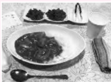
甘口のカレーは大好評でした

会場はボランティアが自宅の一部を開放し、家庭的で温かな雰囲気の場合となっていました。金額は学生が100円(未就学児は無料)で大人が300円、時間は午後5時から8時までで毎月1回行う予定となっています。