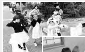
指定されている民家を訪問