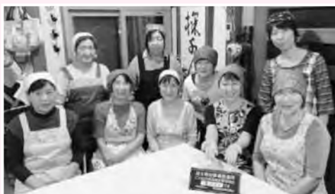
チームワークが抜群のメンバーです

開始にあたっては、浦和競馬こども基金の申請を行い、野菜やお米等の寄付も募集しました。