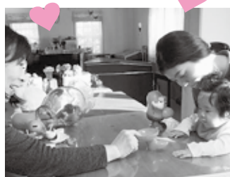
実際の活動の様子