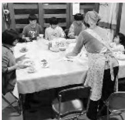
ベテラン主婦のカレーは一味違います

当日は、未就学児から中学生までの子どもと大人を合わせ、20人以上が集まり、食堂を運営するボランティアとともに食卓を囲み、みな笑顔で楽しいひと時を過ごされました。