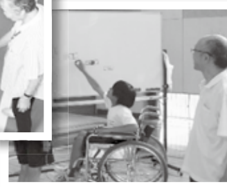
(福祉体験：車いす体験・高齢者疑似体験の様子)