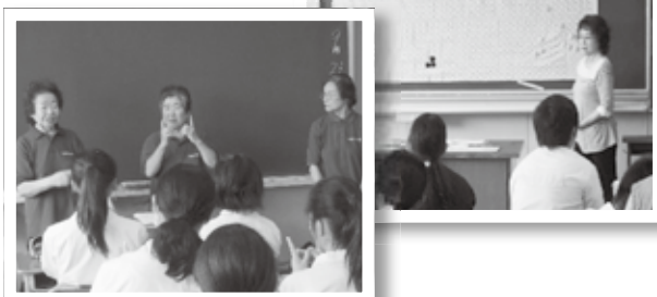
(福祉体験：手話・点字講座の様子)

「耳の不自由な人は、口と手、表情を見て、何を話しているかわかるんだなと思いました。」