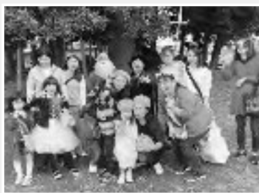
みなさん可愛い仮装

仮装した子どもたちは大人と一緒に、グループに分かれ、地図を片手に「子ども110番の家」に