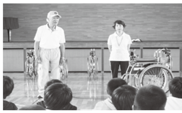
(福祉体験：車いす体験の様子)

福祉体験スクールは、主に市内の埼玉県福祉教育・ボランティア学習推進員や各分野に精通するボランティアに講師としてご協力頂いています。