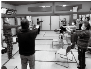
健康体操ハピネス(第一地区)

具体的には、住民の方々が抱える様々な福祉問題について、民生委員、自治会、関係福祉団体、行政等と協力して解決を図っています。その活動財源の一つが、会員の皆さまからの会費です。