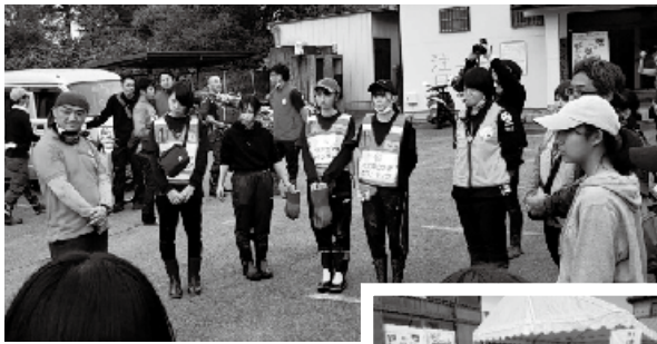
令和元年度 災害ボランティアセンター (名細地区)