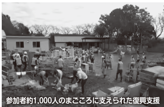
参加者約1,000人のまごころに支えられた復興支援

赤い羽根共同募金で集まった募金は、毎年災害等準備金として積み立てられています。都道府県の区域を単位に行われている共同募金ですが、大規模な災害が発生した場合には、都道府県域を超えて全国の共同募金会が災害等準備金を拠出しあって被災地を支援しています。 昨年の台風19号で川越市は大きな被害を受けました。被災地支援のための災害ボランティアセンターの立ち上げやボランティア活動の支援をするために災害等準備金が役立てられました。