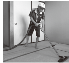
男性も活躍しています!