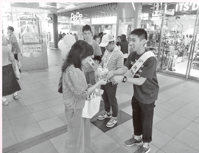
令和元年度 街頭募金の様子 (左上:南古谷駅 右上:川越駅 左下:霞ヶ関駅 右下:本川越駅)