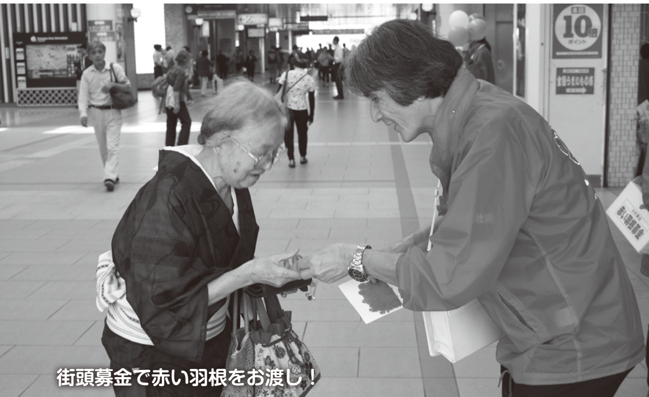
街頭募金で赤い羽根をお渡し！