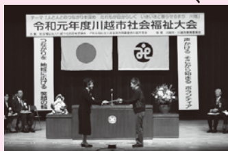
昨年度の福祉大会の様子

また、表彰者の皆さまの中でご希望の方は、活動の写真を市社協宛まで送っていただければ、市社協ホームページで紹介いたします。ご応募お待ちしております。