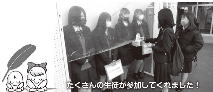
たくさんの生徒が参加してくれました！

令和2年12月1日(火)、2日(水)に川越総合高等学校JRC部で募金活動をしていただきました。当日は、新型コロナウイルス感染症防止対策のため、ビニールのパーティション越しでの活動となりましたが、高校生らしいオリジナルの募金箱を活用するなど、にぎやかな活動となりました。