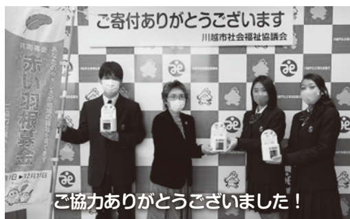
ご協力ありがとうございました！

令和2年12月1日(火)、2日(水)に川越総合高等学校JRC部で募金活動をしていただきました。当日は、新型コロナウイルス感染症防止対策のため、ビニールのパーティション越しでの活動となりましたが、高校生らしいオリジナルの募金箱を活用するなど、にぎやかな活動となりました。