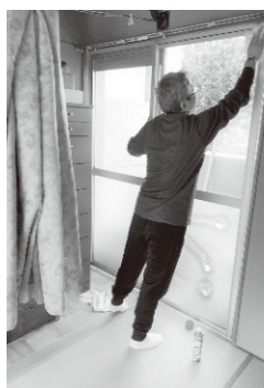
できることで たすけあい