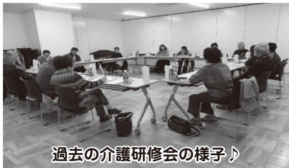
過去の介護研修会の様子♪

川越市在宅介護者友の会は、家族の介護をしている方や過去に家族介護を経験された方が、介護者サロンや介護研修会、施設見学会、リフレッシュバスハイク等の活動を通して、心と体をリフレッシュできるような活動する介護者のための会です。