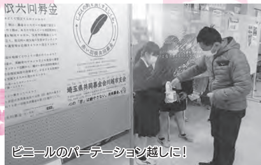
ビニールのパーテーション越しに!

昨年12月に新型コロナウイルス感染症対策をしながら、高校内で募金活動をしていただきました。たくさんの方の生徒に参加していただき、にぎやかな活動となりました。