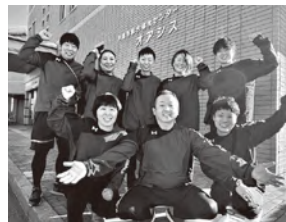
私達が笑顔でお迎えます！