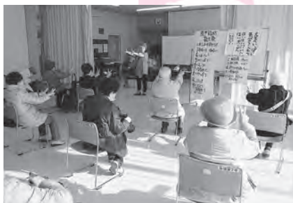
霞ヶ関北地区社協 一人暮らし高齢者集い

地区社協が地域の一人暮らし高齢者を対象に、交流や集いの場をつくっています。(歳末)