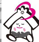
令和2年12月14日(月)に、うず潮レーシングの方がオアシスに来館し、寄付金をいただきました。

有期労働契約職員募集 ドライバー(週3日) 時給990円 デイサービスの運転業務等 事務員 時給940円 デイサービスの事務作業(ワード・エクセル使用)等 ※いずれも原則残業なし。その他必要な資格及び労働条件は、左記までお気軽にお問い合わせください。 提出先・問合せ 市社協 総務担当 ☎225-5703(代表)