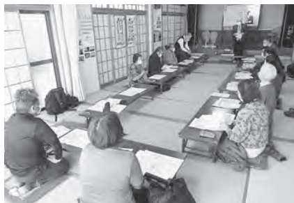
第6地区社協 福祉懇談会