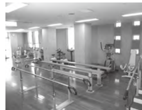
リハビリ室の様子