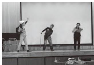
広谷小学校での認知症サポーター養成講座の様子

市社協ボランティアセンターでは、認知症の方を見守り、応援する人を育成する認知症サポーター養成講座を、市内の小中学校で実施しています。キャラバンメイト（認知症サポーター養成講座の講師）にご協力していただき寸劇などを交えて講座を実施しています。