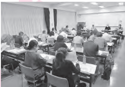
古谷地区社協 福祉懇談会

地区社協が福祉に関する問題の把握及び解決に向けた話し合いをするために設置しています。(赤い羽根)