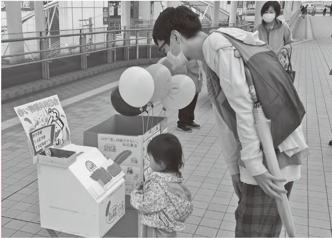
市社協職員による川越駅周辺での街頭募金活動