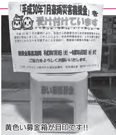
黄色い募金箱が目印です!!

東洋エアゾール工業(株)川越工場、カジマメカトロエンジンニアリング(株)、仲村重機(株)、双葉紙器(有)、川越総合卸売市場(株)