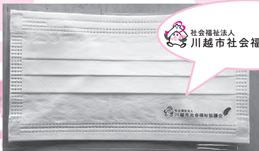
福っくらちゃんと赤い羽根のプリント