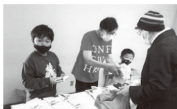
みんなの川越はあとパントリー (こどもの居場所づくり フードパントリーの様子)