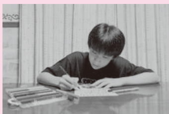
令和4年度の活動の様子