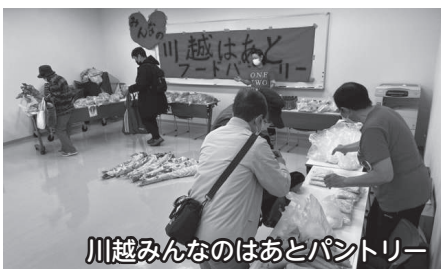
川越みんなのあとパントリー

地域の支援団体が、生活にお困りの世帯などを中心に、企業等から提供いただいた食品等を無料で配布しています。