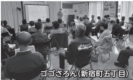
ゴゴさろん(新宿町五丁目)

孤立防止、介護予防、生きがいづくりや健康づくり等を目的として、自治会館や個人宅等を活用し、地域住民同士が定期的集まって仲間づくりや交流の場を広げる活動をしています。