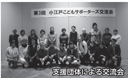
支援団体による交流会

地域の支援団体が、子ども等を対象に無料または低額で利用できる食堂の運営や子どもを対象に学習支援をしています。