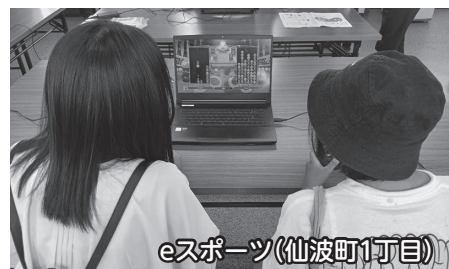
eスポーツ(仙波町1丁目)

市社協からeスポーツ、ボッチャやモルックの機材を借り、地域の自主グループ等で介護予防等を目的に活動をしています。