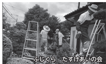
ふじくら たすけあいの会

地区社協、自治会や地域住民が主体となり、日常生活でちょっとした困りごとを抱えた世帯を対象に家事支援サービス等を行っています。