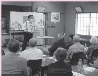
一人暮らし高齢者集い事業