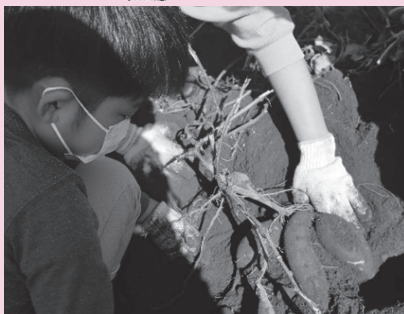
在宅障害児招待事業「芋ほり」