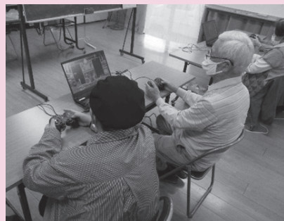
eスポーツ推進事業