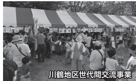
川鶴地区世代間交流事業

各地区社協では、一人暮らし高齢者集い事業や世代間交流事業など実施し、地域の交流の場づくりをしています。