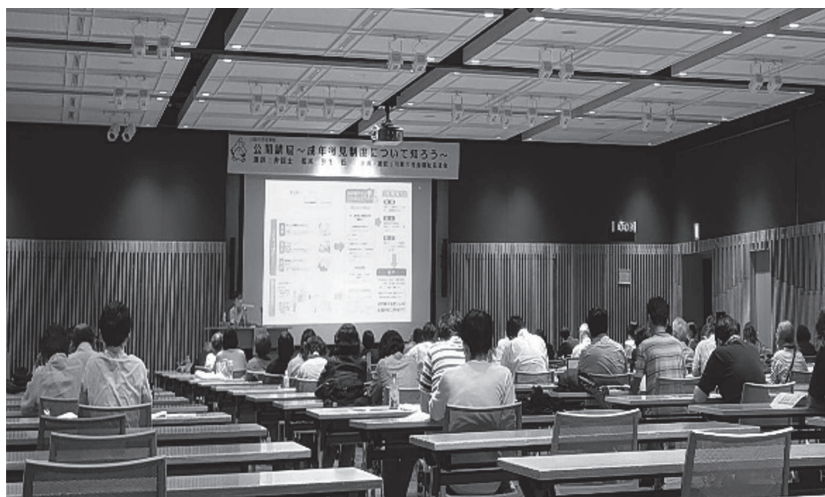
昨年度の様子 70名の方が参加されました！