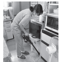
室内の掃除支援の様子です!

当センターでは、在宅で家事の支援を必要としている方に、協力会員を繋ぎ、暮らしの一部を支援しています。