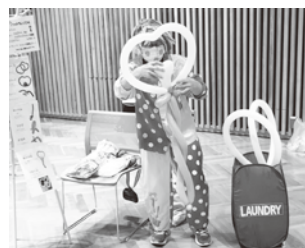
「イベントでの活動」