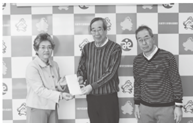
西小仙波町一丁目自治会