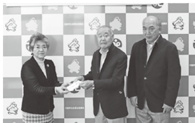
西小仙波町二丁目自治会

また、2月20日(火)には川越市災害ボランティア登録者一同による街頭募金が川越駅で行われました。