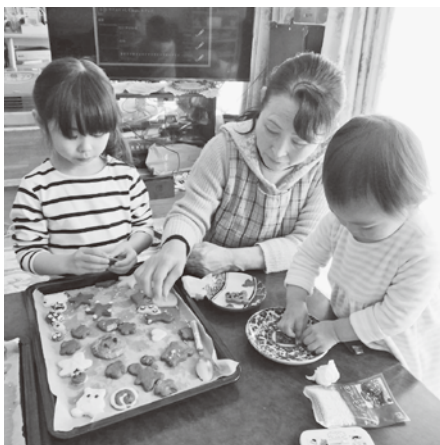
一時預かりの様子

ファミリー・サポート・センターでは、子育ての援助を提供したい方と依頼したい方がそれぞれ会員登録をして子育ての相互援助活動を行っています。