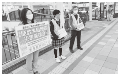
川越駅での街頭募金