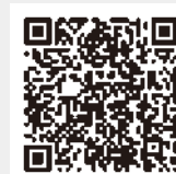
ミニフットゴルフの様子はこちら