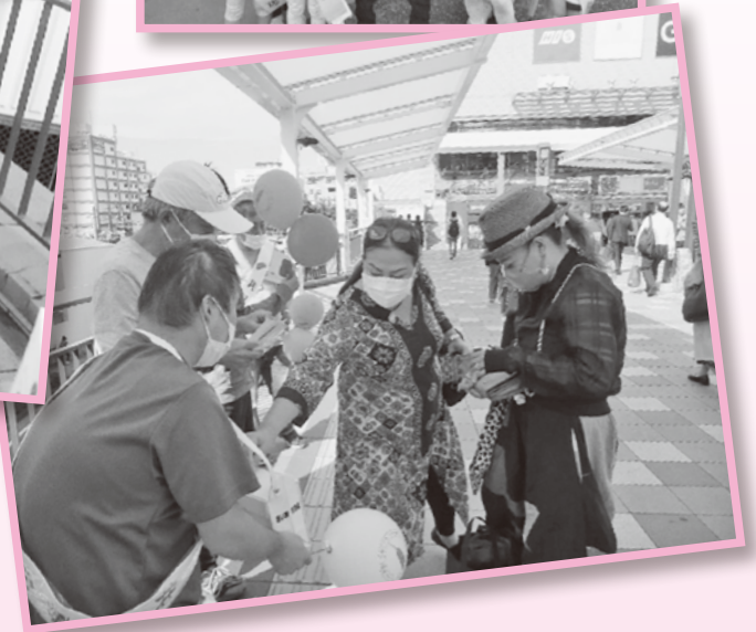
川越駅・南古谷駅での街頭募金の様子