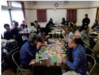
③地区別福祉懇談会事業