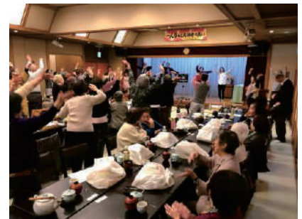
一人暮らし高齢者集い事業 (地区内会場)