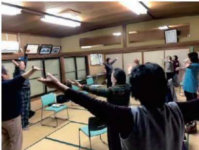
①～⑤いもっこ体操教室(健康体操ハピネス)