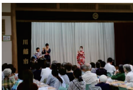
⑩一人暮らし高齢者集い事業