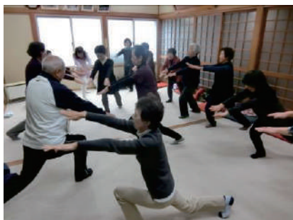
①④～⑥⑨いもっこ体操教室