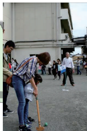
世代間交流事業 ⊗川越小