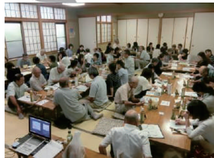
①地区別福祉懇談会事業