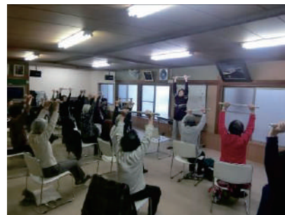
①④プラン事業（介護予防体操）