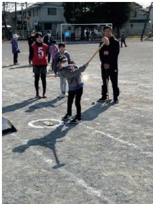
世代間交流事業 ◎川越第一中