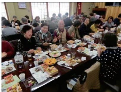
①一人暮らし高齢者集い事業