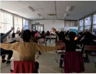
①～③岸町3丁目いもっこ体操教室