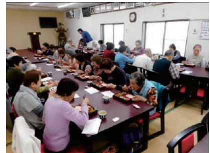
④在宅高齢者等給食サービス事業