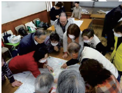
⑤福祉協力員等事業(災害マップ作り)