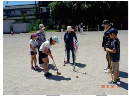
世代間交流事業 ⊗月越小