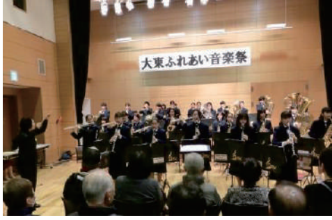
大東ふれあい音楽祭 ●大東市民センター