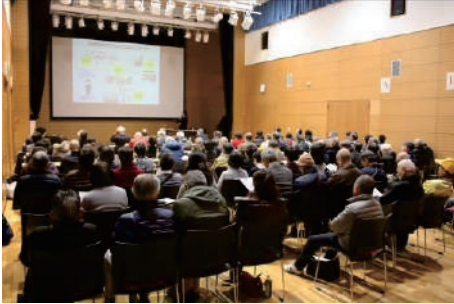
地区別福祉懇談会事業 ●大東市民センター