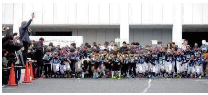
②大東ふれあいマラソン&ウォークソン大会