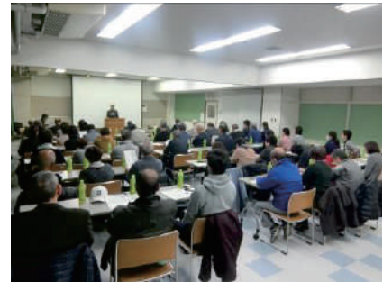
地域福祉部会 ●霞ヶ関公民館