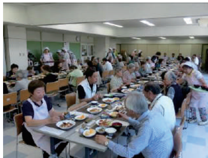
ぎんれい ●霞ヶ関公民館