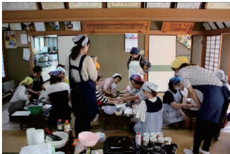
③的上ほのぼの料理クラブ