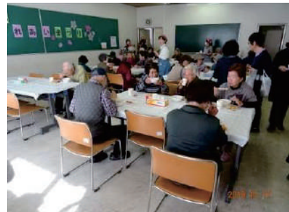
地域ふれあいまつり ●霞ヶ関北公民館