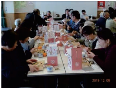
一人暮らし高齢者集い事業 ●霞ヶ関北公民館