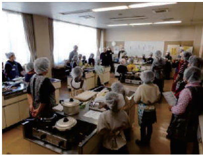
世代間交流事業 ●川鶴公民館