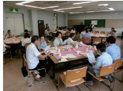
地区別福祉懇談会事業 ●川鶴公民館