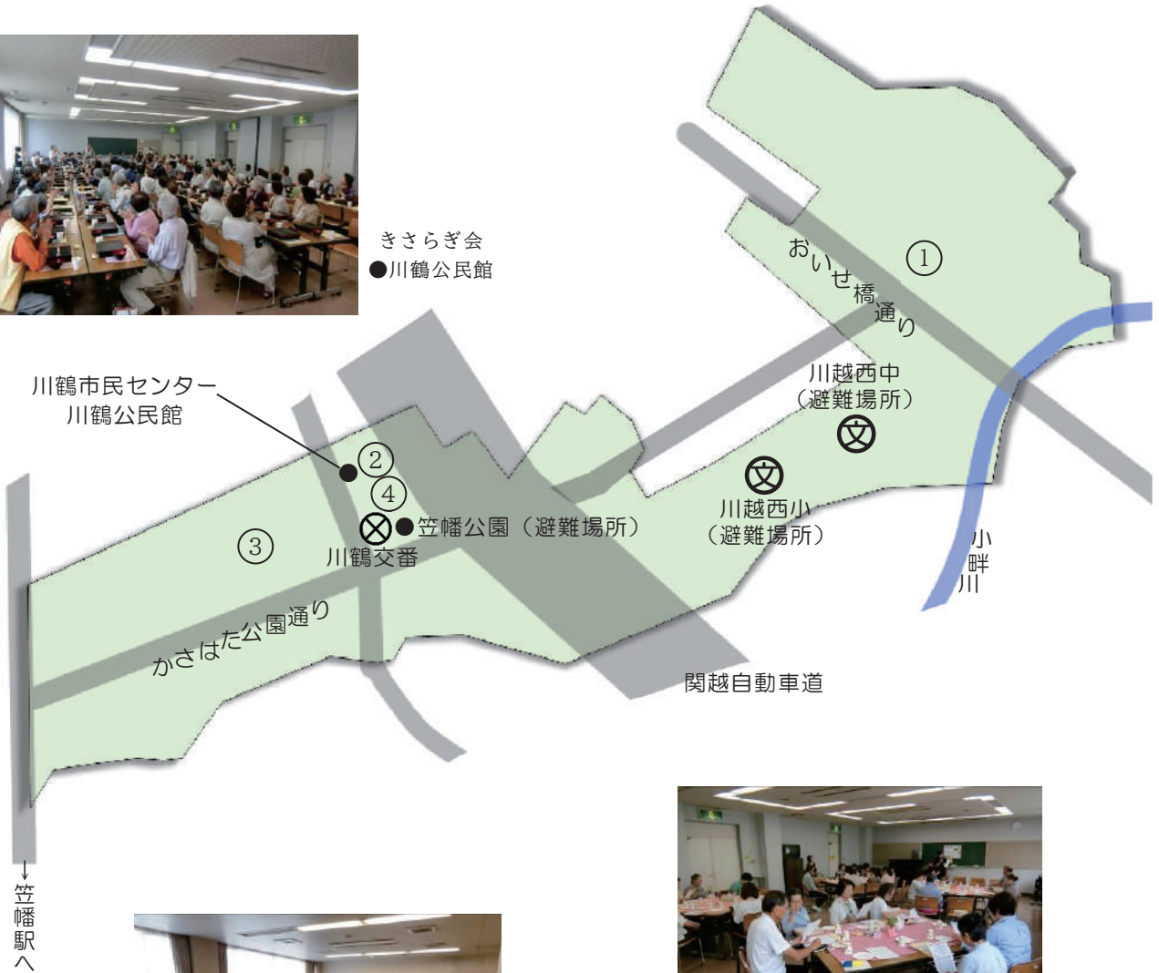
川鶴市民センター 川鶴公民館