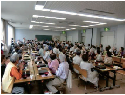
きさらぎ会 ●川鶴公民館