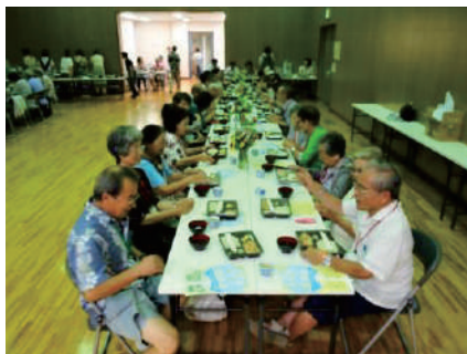
在宅高齢者等給食サービス事業 ●東部地域ふれあいセンター