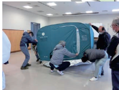
総合防災訓練 ●東部地域ふれあいセンター ☉南古谷小