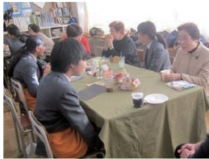
南古谷中学校 いきいきサロン ☉南古谷中