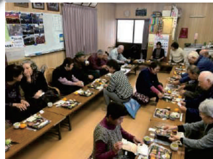
③⑤⑦⑧⑳㉒～㉔一人暮らし高齢者集い事業