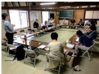
①⑥⑧⑯⑱地区別福祉懇談会事業