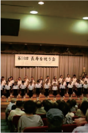
一人暮らし高齢者集い事業 ●北部地域ふれあいセンター