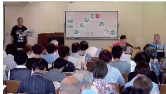
みんなで歌おう会 ●山田公民館