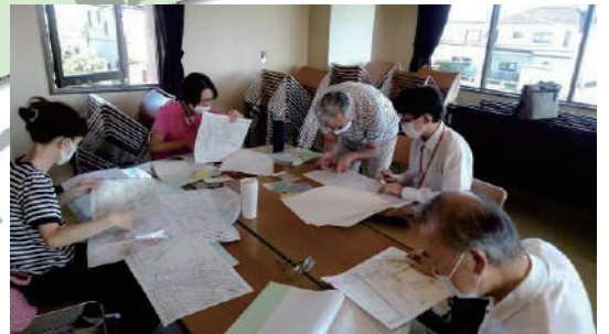
見守りマップ作成 ●山田公民館