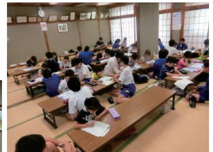
寺子屋 ●芳野公民館